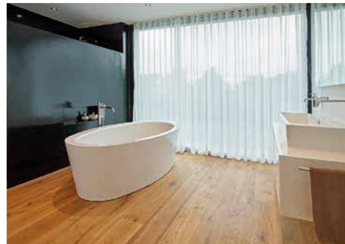
Stilvoll: Vom eleganten Wohn-Esszimmer über den wie ein Designobjekt anmutenden Kaminofen bis zur frei schwebenden Holzterrasse und die frei stehende Badewanne im Obergeschoß verfügt dieses Haus in Höchst über ein villenartiges Ambiente.

Dieter Vetter bereits für ein Familienmitglied der Bauherrin ein Objekt geplant hatte, herrschte Einigkeit über Grundstruktur und Ausrichtung des Gebäudes. Details wurden gemeinsam mit den Bauherren erarbeitet. Im Eingangsbereich befinden sich sowohl eine Gäste- als auch eine Privatgarderobe mit klarem Schwarz-Weiß-Kontrast. Der schöne Holzparkett aus geräucherter und geölter Eiche im Wohnbereich wird über die attraktive, schwebende Eichentreppe mit flankierender Glasabsturzicherung ins Obergeschoß bis ins Bad fortgesetzt.